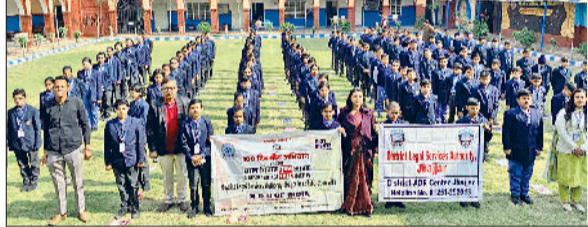
चरखी दादरी। मोबाइल का आवश्यक उपयोग छोड़ने की शपथ लेते विद्यार्थी।